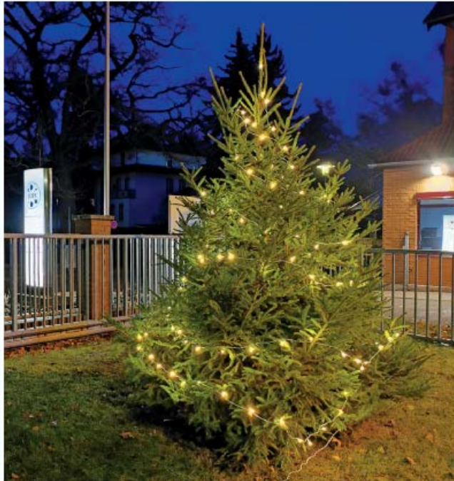
Weihnachtliche Stimmung in Zeuthen beim Eingang.